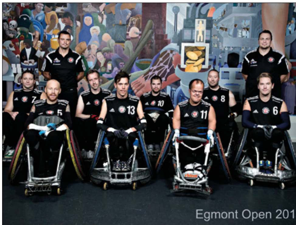
Egmont Open 201