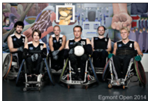
Egmont Open 2014