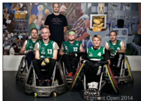
Egmont Open 2014