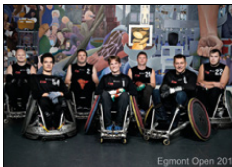
Egmont Open 201