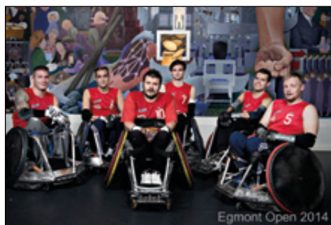
Egmont Open 2014